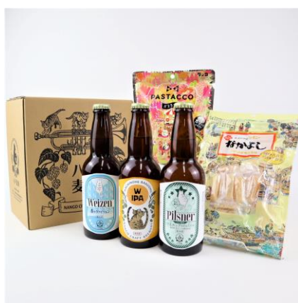
【八戸初！クラフトビールと おつまみセット】