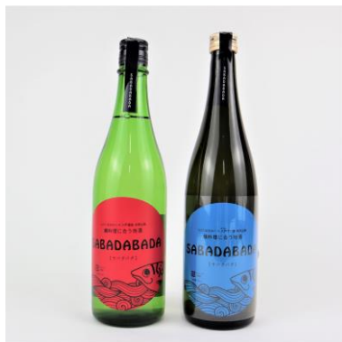
【鯖料理に合う地酒・SABADABADA】