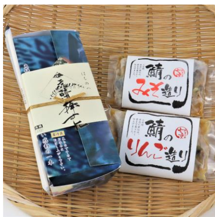
【八戸ニューシティホテル 虎鯖棒すしギフトセット】