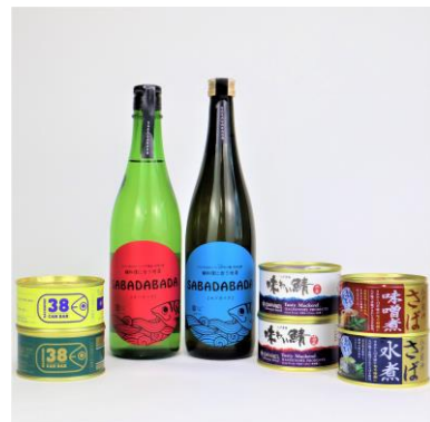
【SABADABADA & サバ缶