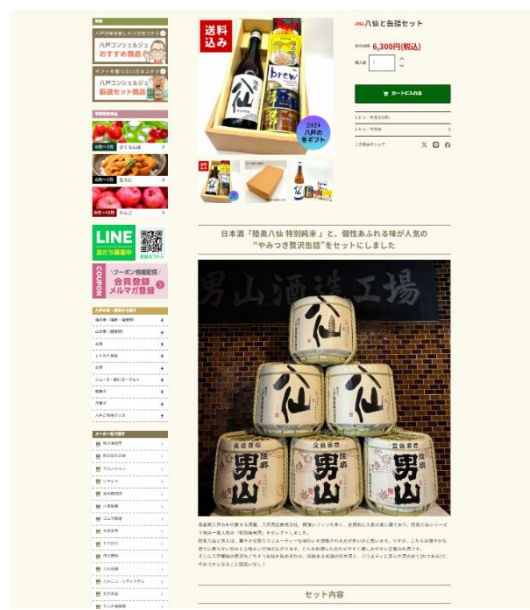
冬のおすすめギフトの商品のページ (一例)